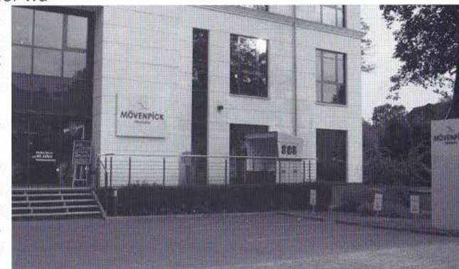
Abb. 1: Mövenpick Weinkeller in der Theodorstraße

HB: Mövenpick ist hier in Hamburg sehr vielschichtig vertreten. Hier in Bahrenfeld und in Sasel haben wir